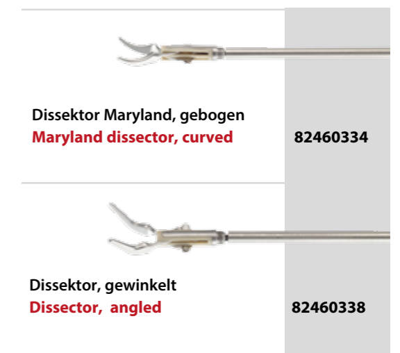
Dissektor Maryland, gebogen Maryland dissector, curved 82460334