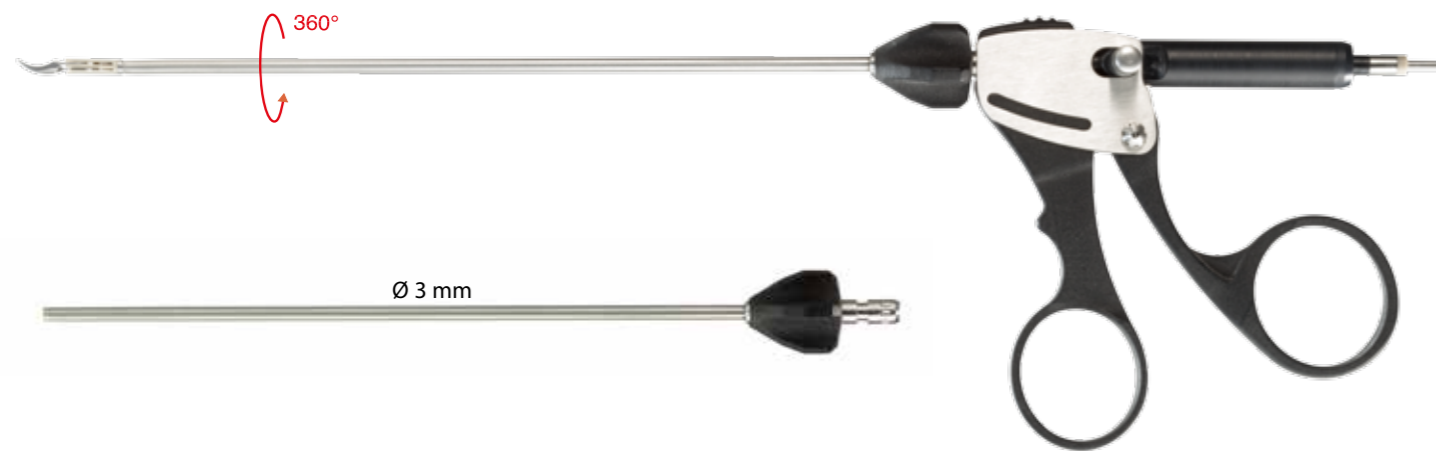
Mithras Ringgriff Mithras ring handle